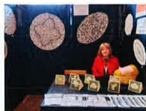
Lepoglavska čipka na festivalu čipke u Primoštenu