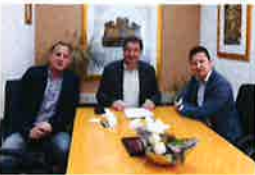
Gradske komunalne investicije vrijedne više od 1.5 milijun eura