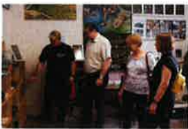
Velika gradska potpora lovstvu na području Lepoglave