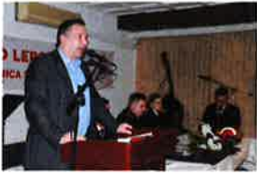
Održana Skupština Limene glazbe Lepoglava