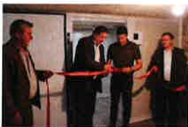
Proslavljen Dan Dječjeg vrtića Lepoglava