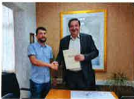
Dan otvorenih vrata P.A.S. kluba Lepoglava