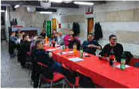
Održane 11. Kazališne noći