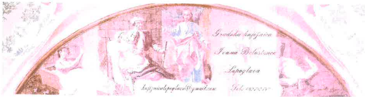
Slika 1: Bookmark Gradske knjižnice Ivana Belostenca Lepoglava

Iznimno popularan i poznati marketinški proizvod, naše označnice (slika 1.), ujedno i suvenir, traženi su od korisnika a također od posjetitelja i turista. Nastojimo otisnuti poneko novo izdanje s motivima vezanim uz naše okruženje kako bismo zadržali interes i ponudili novi proizvod s mnogo širom porukom od njegove primarne svrhe. Bookmark kao „podsjetnik u malome“ sadrži sve važne podatke vezane uz našu Knjižnicu; radno vrijeme, mail, kontakt, te sa stražnje strane kalendar.