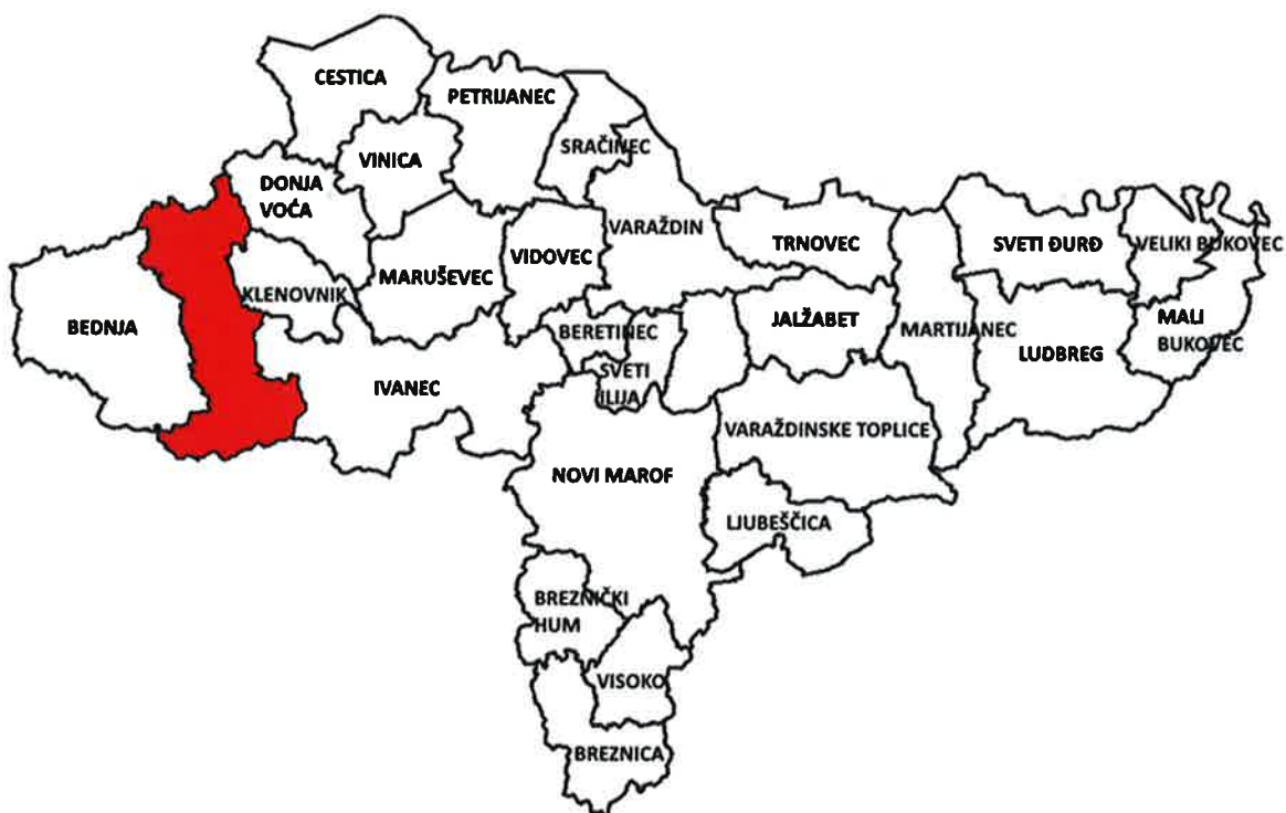
Slika 1. Geografski položaj Grada Lepoglave u Varaždinskoj županiji

Grad Lepoglava smješten je na zapadnom dijelu Varaždinske županije i graniči na sjeveru s Republikom Slovenijom (pa je dio njezina teritorija granično područje), na jugu s Krapinsko-zagorskom županijom, na istoku s Gradom Ivanec i općinama Klenovnik, Donja Voća, a na zapadu s Općinom Bednja. Površina Grada Lepoglave iznosi 66,42 km 2 , a u svom sastavu obuhvaća ukupno 16 naselja i to: Bednjica, Crkovec, Donja Višnjica, Gornja Višnjica, Jazbina Višnjička, Kamenica, Kamenički Vrhovec, Kameničko Podgorje, Lepoglava, Muričevac, Očura, Viletinec, Vulišinec, Zalužje, Zlogonje i Žarovnica.